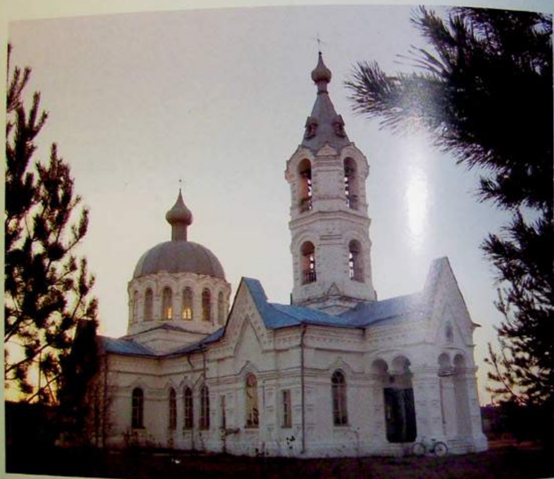
Михаило-Архангельский храм с. Русское. Год 2006-й от Рождества Христова

По благословению митрополита Вятского и Слободского Хрисанфа